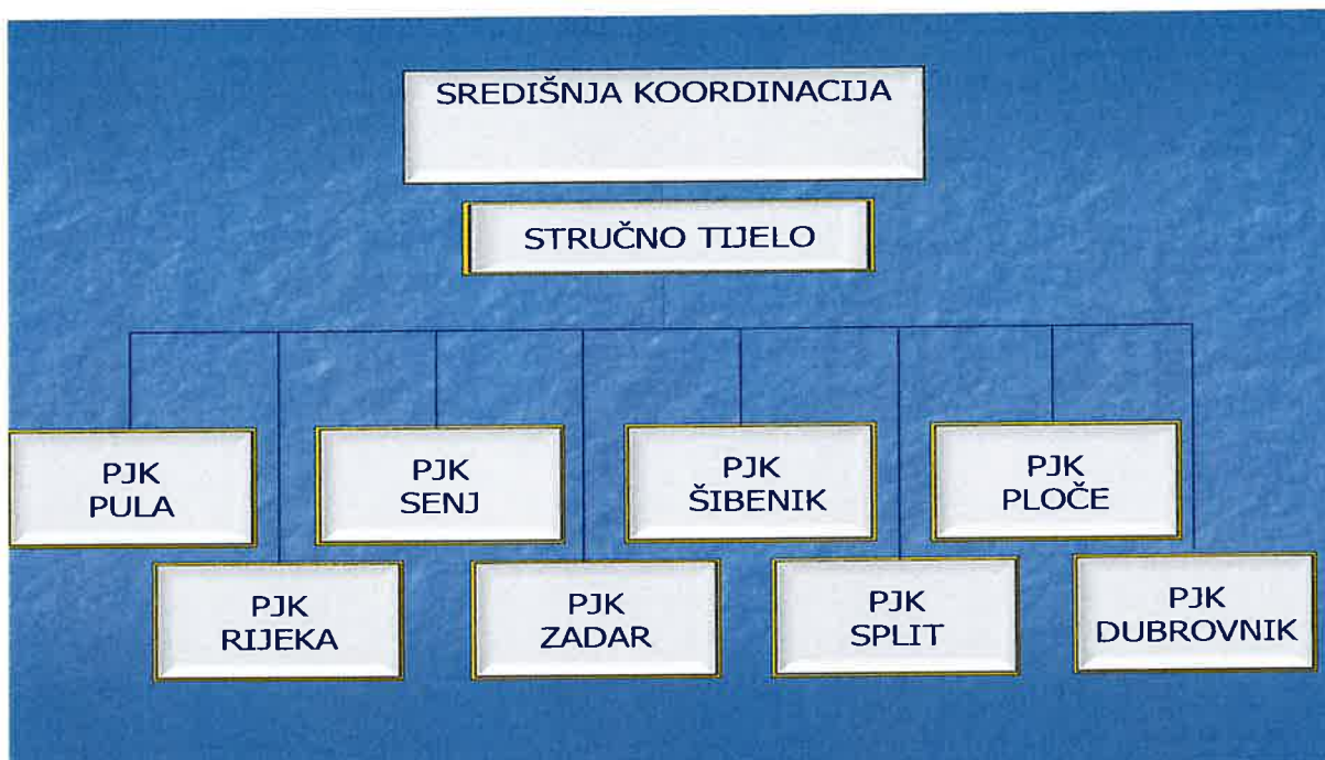
Slika 2.: Ustroj i struktura zajedničkog sustava nadzora mora